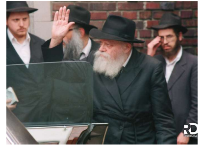
РЕБЕ ШЛИТА КОРОЛЬ МОШИАХ

Поэтому предлагаю финансово поддержать сайт «МОШИАХ.ру», который уже десятки лет обеспечивает евреев и евреек по всему миру истинным знанием о Торе и заповедях и по указанию Любавичского Ребе ШЛИТА Короля Мошиаха информирует другие народы мира о жизненно важной необходимости соблюдения ими 7 заповедей для неевреев.