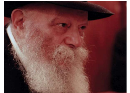
РЕБЕ ШЛИТА КОРОЛЬ МОШИАХ

Так когда всё это началось? Накануне 11 Швата 2011 года — в день 60-й годовщины вступления Ребе Короля Мошиаха на престол.