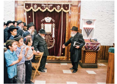
РЕБЕ ШЛИТА КОРОЛЬ МОШАХ

И Освобождение наступит «как в дни выхода из Египта», когда Всевышний показал евреям чудеса, открыто для всех, в ближайшем будущем.