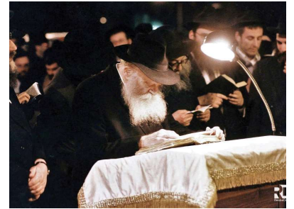
РЕБЕ ШЛИТА КОРОЛЬ МОШИАХ

Увы, к нашему большому сожалению, согласно опубликованным в прошлом сообщении, ХАМАС уже нанёс ужасный физический вред нашим похищенным (которые также подверглись со стороны врагов многим издевательствам), да будет милостив к ним Всевышний. Именно поэтому важнейшим и необходимым условием каких-либо переговоров с врагом, должно быть требование точного списка заложников и их физического состояния, а также гарантии того, что они будут возвращены в целости и сохранности.