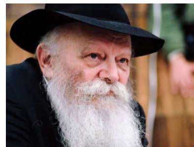
РЕБЕ ШЛИТА КОРОЛЬ МОШИАХ

И это будет каналом, через который пройдет хорошая подпись и печать в новом году в открытом и скрытом добре, в материальном и духовном смысле в дни Рош а-Шана и после этого в течение всего года.