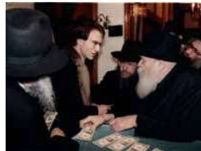
РЕБЕ ШЛИТА КОРОЛЬ МОШИАХ

Сегодняшние технологии не отдаляют нас от веры, а становятся наглядным пособием, помогающим осознать величие Всевышнего через Его творения.