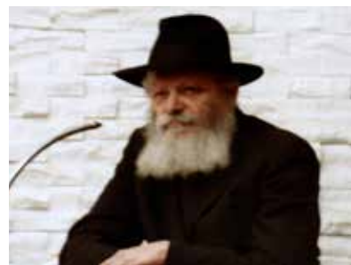
РЕБЕ ШЛИТА КОРОЛЬ МОШИАХ

Сам факт, что на государственном уровне в США звучит призыв обратить внимание на субботу — день покоя, благодарности и обращения к Всевышнему — выглядит как отражение тех процессов, которые традиция связывает с приближением этой эпохи.