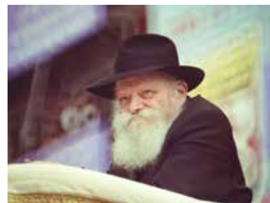
РЕБЕ ШЛИТА КОРОЛЬ МОШИАХ