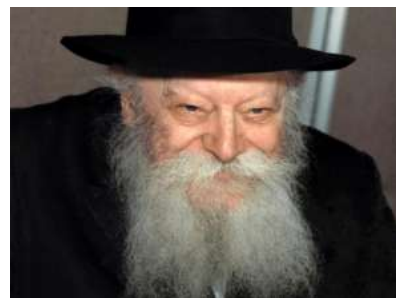
РЕБЕ ШЛИТА КОРОЛЬ МОШИАХ

В конечном счете, послание Ребе ясно: «Не будем повторять ошибок прошлого. Отступление не приведет к миру, а лишь к дальнейшим конфликтам. Когда Израиль защищает себя согласно Торе, он не только обеспечивает свое выживание, но и гарантирует будущее истинного мира и искупления, когда „народ не поднимет меч на народ“ и „мир и спокойствие будут в его дни“».