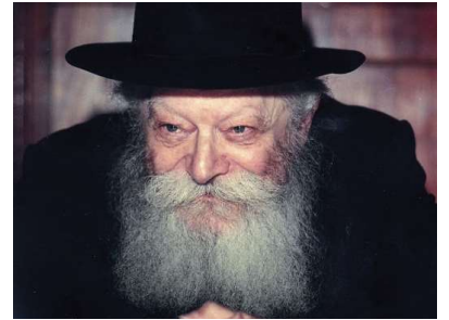
РЕБЕ ШЛИТА КОРОЛЬ МОШИАХ

Если так, то голубь мог принести только свежий листок, появившийся после потопа. Сами деревья перенесли потоп и начали давать новые листья, когда сошла вода. Один из таких листков и принес голубь, а Ноах, увидев, что это свежий листок (ведь нетрудно заметить разницу между свежим листком и листком, долго бывшим в воде), понял, что вода сошла.