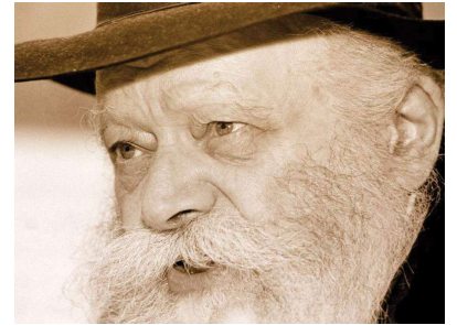
РЕБЕ ШЛИТА КОРОЛЬ МОШИАХ

В любом случае, говорит Ребе ШЛИТА Король Мошиах, во время Освобождения народы мира сами отдадут все эти земли евреям и не будет необходимости воевать ради этого.