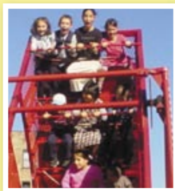
ЦИНОВКА ВМЕСТО КРЫШИ